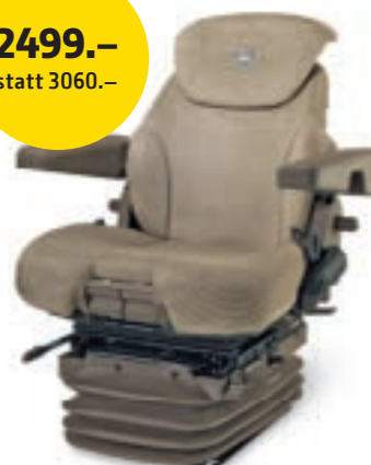
Super Komfortsitz «Deluxe» Serien: 6000, 6M, 6R BL16318