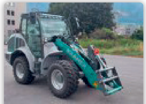
Kramer KL 43.8