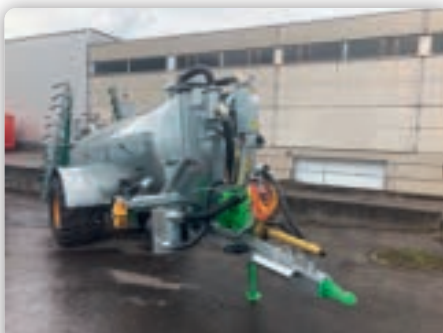
Güllenfass Joskin Alpina 2 8000 Vacuum