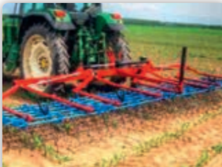
Hatzenbichler Striegel 6m