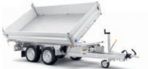
Kipper und Baumaschinentransporter