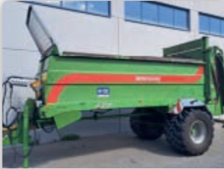
Miststreuer Bergmann M37