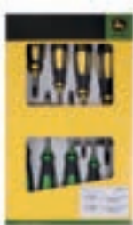
9-teiliger Schraubendreher-Satz Art.-Nr.: MCKTA31101M