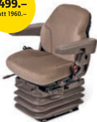
Komfortsitz Serien: 6000, 6M, 6R BL16299