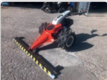
Aebi Motormäher CC56