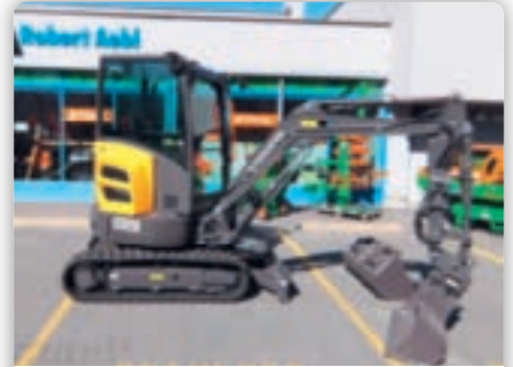
Kompaktbagger Volvo ECR25D