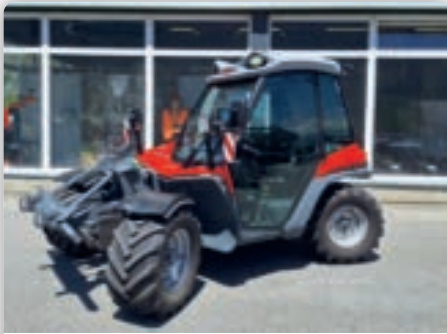
Aebi Tertatrac TT281