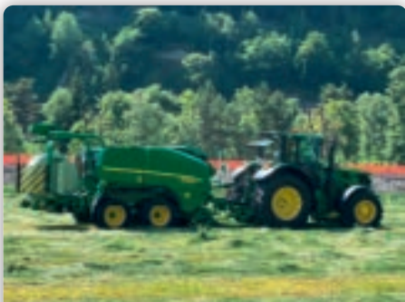
John Deere C441R