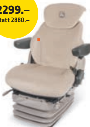
Super Komfortsitz Serien: 5R MANNHEIM, 6MC, 6RC BL15120