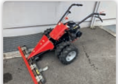
Köppel Mäher VR6